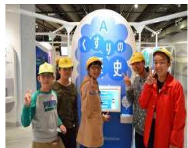
【修学旅行科学技術館 6年】