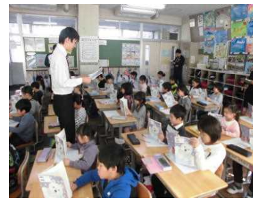
【高田先生授業研究 2年】