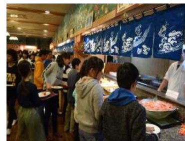
【修学旅行ホテル三日月 6年】