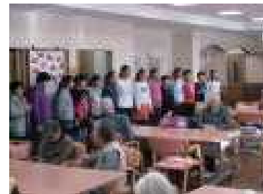
【福祉交流会 JRC委員会】